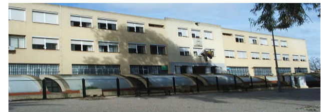
IES CASTELAR (BADAJOZ)